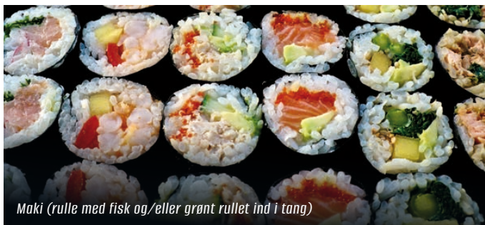
Maki (rulle med fisk og/eller grønt rullet ind i tang)