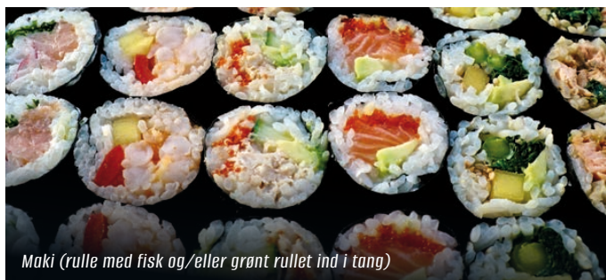
Maki (rulle med fisk og/eller grønt rullet ind i tang)