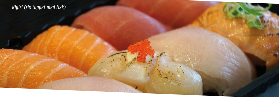
Nigiri (ris toppet med fisk)